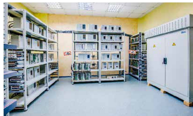
Полигон ПТК «ИНБРЭС»

Начиная работы по направлению цифровизации подстанций и распределительных сетей, мы сразу обратили внимание на многообразие инновационных технологий, которые могут для этого использоваться, а также на разнообразие объектов автоматизации. Стало понятно, что выбор оптимального технического решения — это ключевая задача в каждом инновационном проекте, и мы стали уделять ей особое внимание.