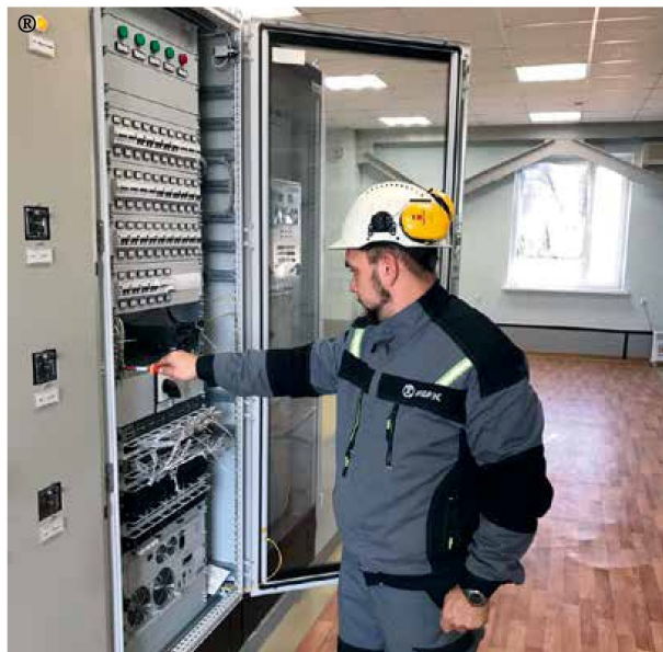
Наладка оборудования в рамках реализации проекта по модернизации систем сбора и передачи информации ПС 220 кВ «Сальская» филиала ПАО «ФСК ЕЭС» — МЭС Юга